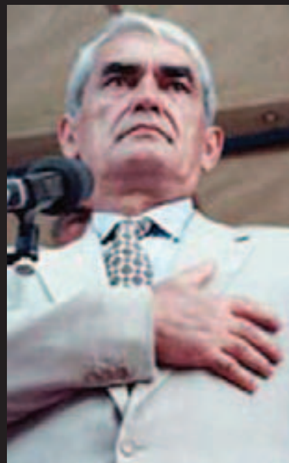
HERCEGOVINA ZA POSAVINU Gojko Šušak, strateg preseljenja naroda u BiH

■ Jedan ste od rijetkih autora koji je, pišući o ratnim zbivanjima, konzultirao sve "zaraćene strane". Kako se odvijala Vaša komunikacija sa časnicima Vojske Republike Srpske?