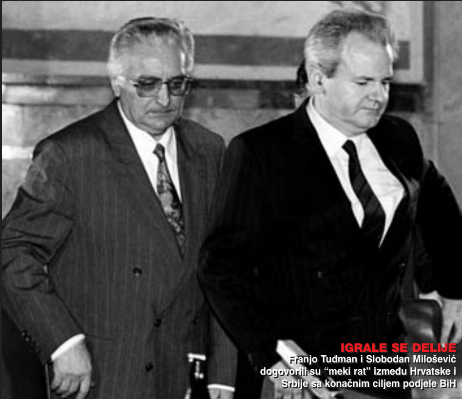
IGRALE SE DELINE Franjo Tuđman i Slobodan Milošević dogovorili su "meki rat" između Hrvatske i Srbije sa konačnim ciljem podjele BiH