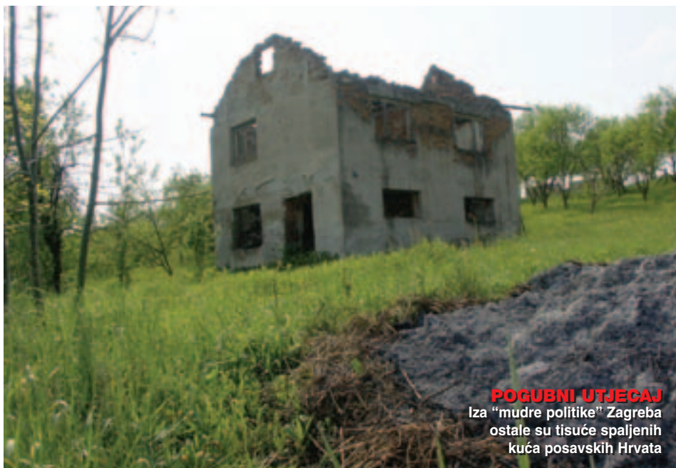
POGUBNI UTJEGAJ Iza "mudre politike" Zagreba ostale su tisuće spaljenih kuća posavskih Hrvata

Na području Bosanske Posavine je ratovalo puno različitih dijelova više jedinica HV-a, ali su u gotovo punom sastavu bile prisutne jedno vrijeme 106. Osječka brigada, a primarno 108. Slavansko-brodsko brigada. Prije odlaska u Posavinu, ti vojnici su već bili prekaljeni, prethodnih šest mjeseci su bili na bojištu. Ja sam osobno prelazio rijeku Savu s ciljem da potisnemo Srbe, da ne tuku po mom gradu, po bolnici, školama, i nisam imao nikakve ideologije. Međutim, kako se situacija na bojištu komplicirala, ljudi su shvaćali da je vrug odnio šalu, a kako je Šušak već bio donio odluku da se u Bosnu ide samo dragovoljno, sve je manje vojnika išlo. Zadnjih osam dana u Bosanskom Brodu lokalna brigada HVO-a je ostala prepolovljena, 60 posto ljudi je bilo izvan stroja. 108. brigada HV-a je imala točno 1438 boraca, i nikada tijekom rata niti jedna hrvatska brigada nije imala toliko boraca na bojištu. Ostale postrojbe HV-a su brojile 540 vojnika, dok je HVO imao 520 boraca. S druge je strane general